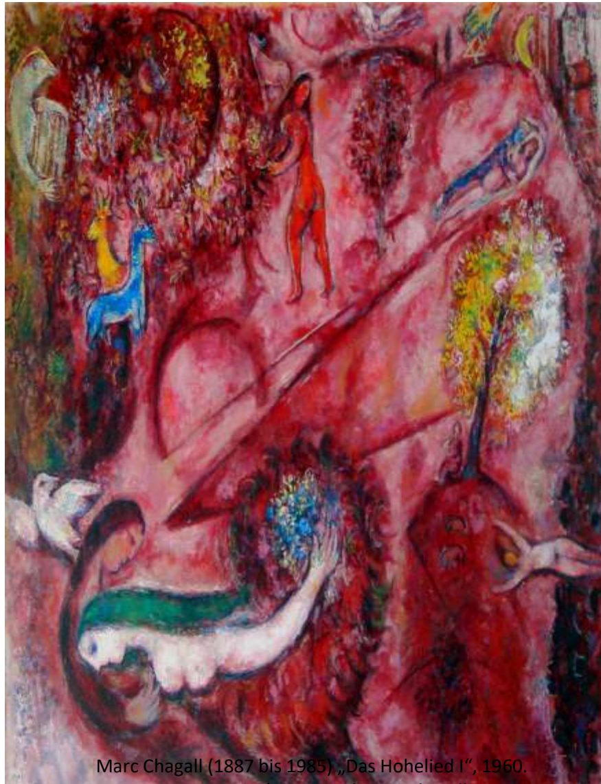
Marc Chagall (1887 bis 1985) „Das Hohelied I“, 1960.