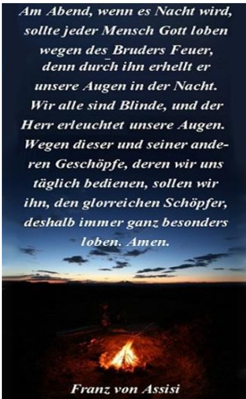
Franz von Assisi

Hl. Messe am Mi., 4.10., um 19 Uhr, mit allen Geschöpfen!